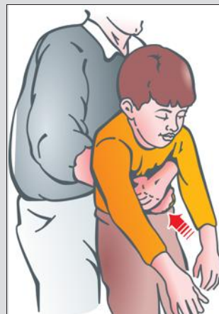
Méthode de Heimlich.