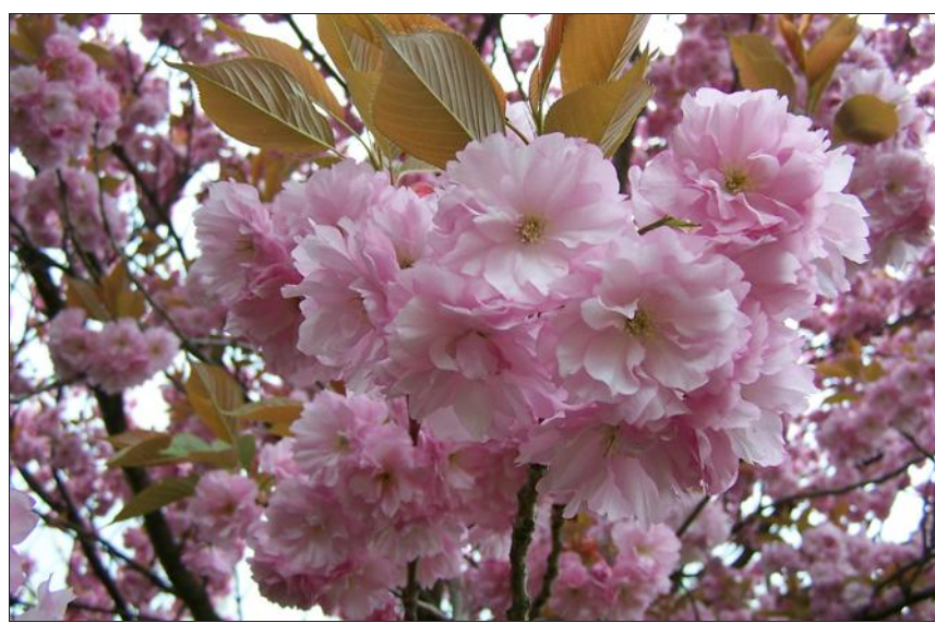
Prunus serrulata en fleurs.

Il faudrait dans ce cas diriger votre choix vers d'autres familles d'espèces fruitières moins courantes qui peuvent, avec quelques soins particuliers, s'adapter à notre zone tempérée : citons le Figuier ( Ficus carica de la famille des Moracées), le Kaki ( Diospyros kaki de la