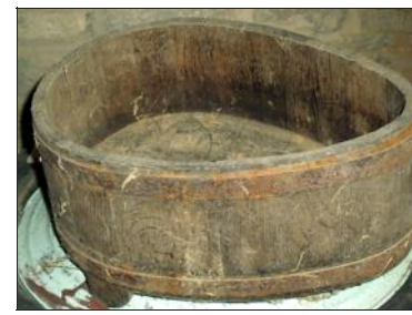
Petite cuve en bois.

• Cette réponse a été préparée en collaboration avec la Société d'Horticulture de la Moselle.